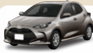
トヨタ ヤリス X 月額 / 7年定額84回払