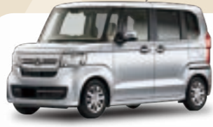
ホンダ N-BOX G 月額 / 9年定額108回払