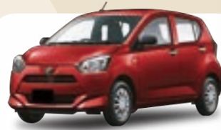
ダイハツ ミライース L 月額 / 9年定額108回払

頭金0円・ボーナス払0円 / 月間走行距離1,000km の場合 ※設定残存価格を除き、表示価格は税込です。