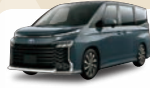
トヨタ ヴォクシー S-G7人乗り 月額 / 5年定額60回払